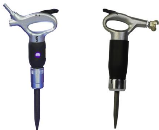
Meißel - & Keillochhämmer