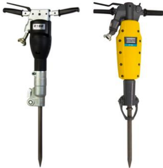
Druckluft - Abbruchhämmer