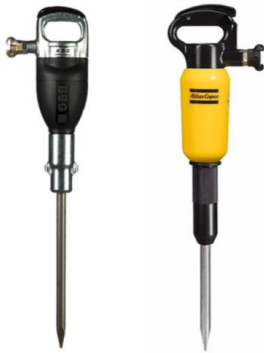
Druckluft - Abbauhämmer

Natursteinbruch | Schotterwerk | Steinverarbeitung Hoch- und Tiefbau | Straßenbau | Abbruchindustrie