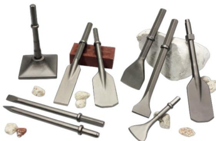
Einsteckwerkzeug & Meißeln